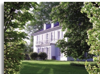
Das Gutshaus in Stocksee